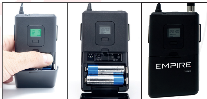
Tasti dedicati per le funzioni On/Off, Volume +/- e Selezione Potenza Segnale Low - High

Low è sufficiente nella maggior parte dei casi in situazioni indoor, dove le distanze sono entro i 30m, e il consumo delle batterie è nettamente inferiore.