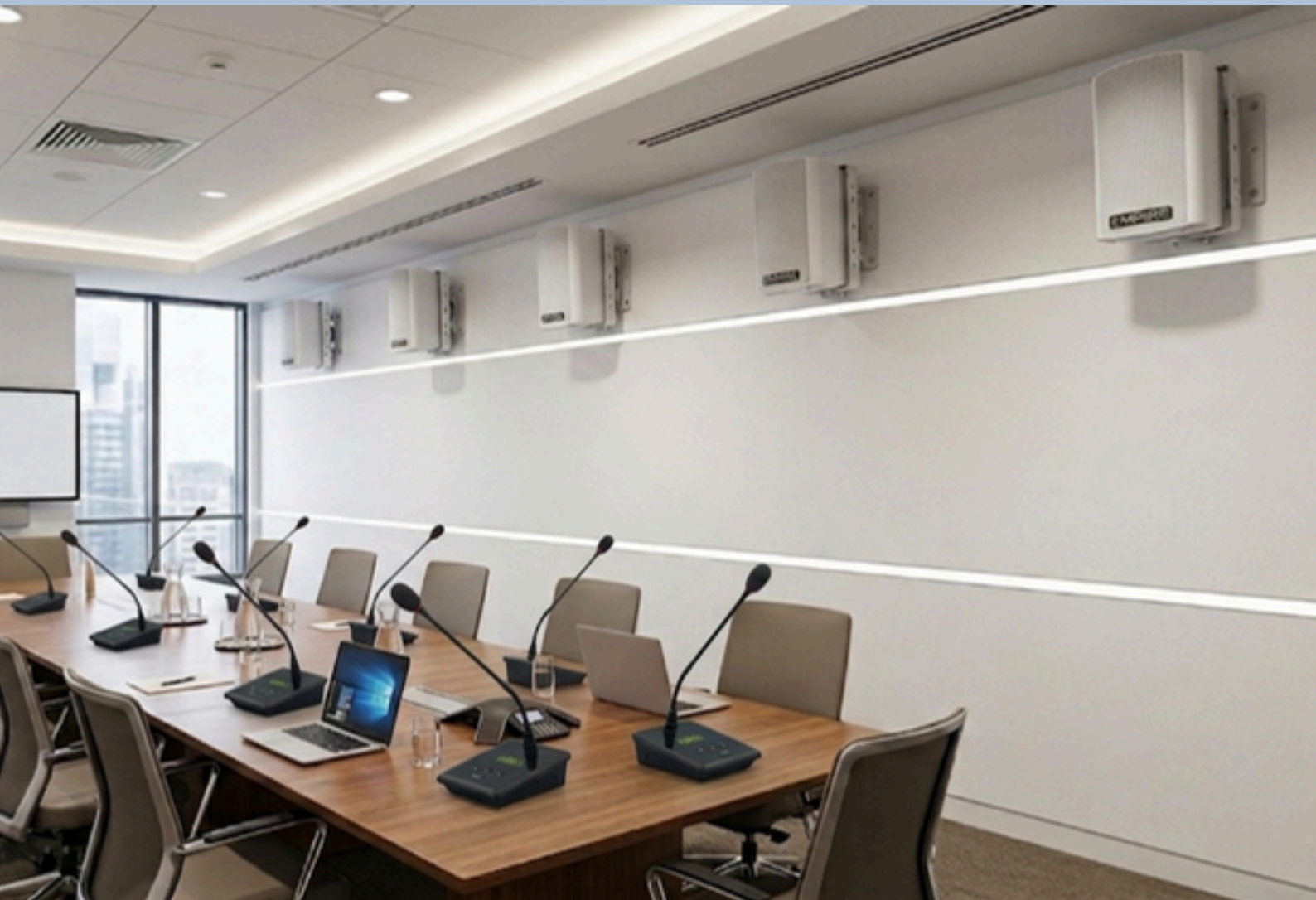
Sala riunioni con gli speaker wireless EMPIRE WALL300 UHF

È compatibile con tutti i trasmettitori EMPIRE "HT", offrendo massima flessibilità per installazioni professionali.